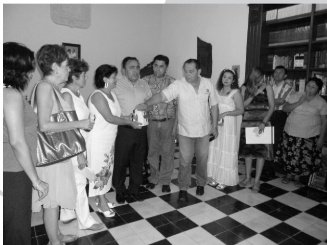
Colecta 2012 en apoyo a la Cruz Roja mexicana.