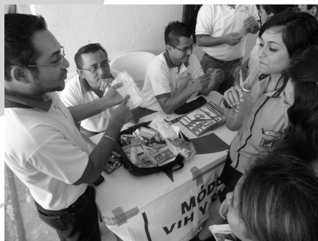
Jornada de salud sexual, Por la educación integral de nuestros jóvenes.