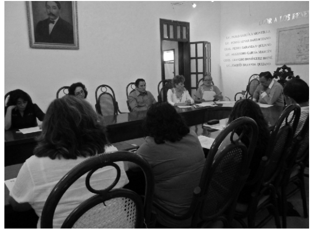
Sesión de consejo en el que se propuso el nuevo plan de estudios para la Escuela de Ciencias de la Comunicación.

Economía, Comunicación, Lingüística, Periodismo, Investigación, Política, Medios, Comunicación Organizacional, Publicidad y Propaganda, Epistemología, Ética, Derecho, Identidad Cultural, Urbana, Rural y Arte , son temas que se consideran en el programa de estudios del nuevo modelo de educación de la Escuela de Ciencias de la Comunicación.