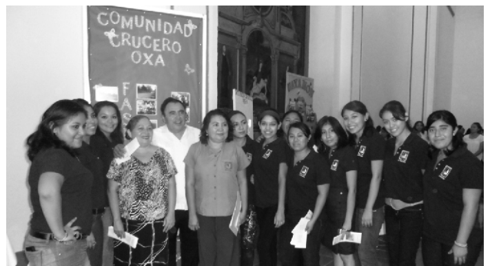
Autoridades en compañía de los alumnos de la escuela.

Actualmente trabaja en la modalidad escolarizada y abierta en la sede de Campeche y se cuenta con campus en los estados de Yucatán, Quintana Roo y Tabasco.