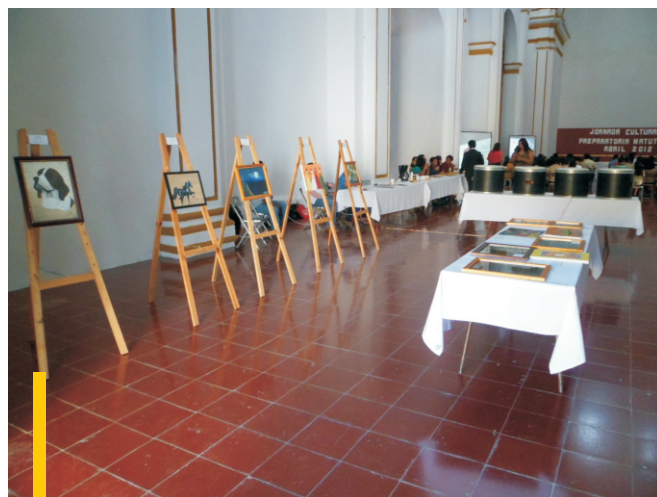
Exposición de trabajos de la jornada cultural 2012.