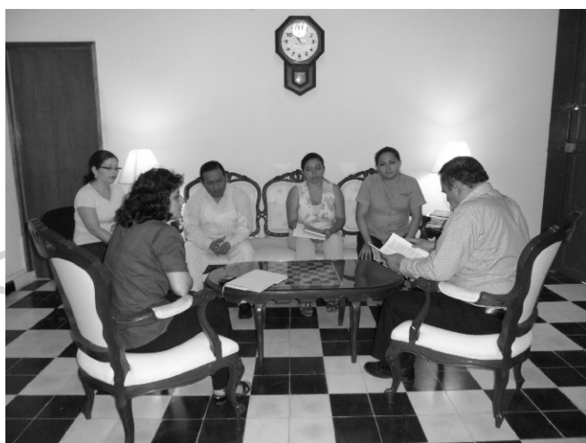
Presentación de la revista Intercambio , espacio para la divulgación científica de nuestro colegio.