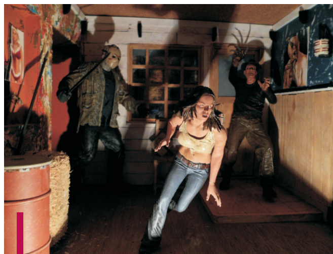
Muestra en miniatura de Freddy y Jason, película de terror del año 2003. Autor: Limberth Gil Rincón.

Durante las jornadas se llevaron a cabo diversas actividades; entre ellas la presentación del último número de la revista Comunicare , conferencias, concursos de declamación, exposición de trabajos y juegos didácticos.