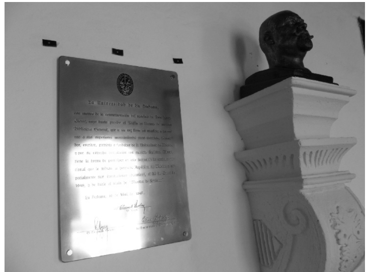
Busto y placa conmemorativa de don Justo Sierra Méndez ubicado en los pasillos del claustro del I.C.

En 1948, en el centenario de su nacimiento, a iniciativa de la Universidad de La Habana, la UNAM, junto con otras universidades del continente, lo declaró Maestro de América . Se editaron sus obras completas en 15 tomos y sus restos fueron trasladados del Panteón Francés, a la hoy Rotonda de las personas ilustres.