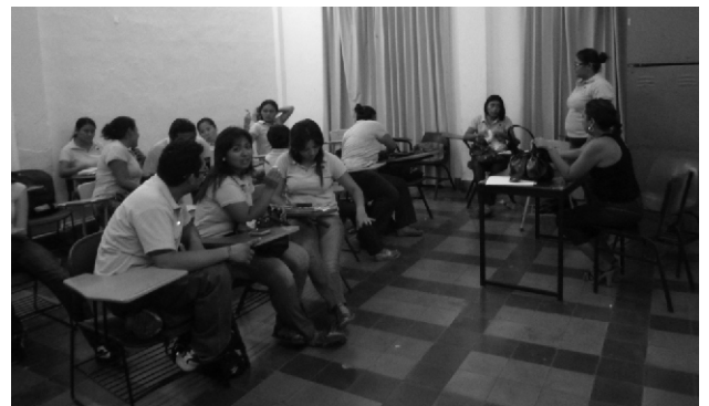
Alumnos de la Escuela de Ciencias de la Comunicación del Instituto Campechano.