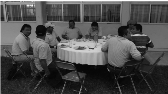
Convivio con el personal del Departamento.

Asimismo, el rector los felicitó por el interés en su desarrollo personal y profesional, y los exhortó a aprovechar la oportunidad de trabajar en la institución educativa para superarse.