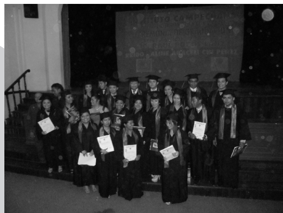
Vigésima tercera generación de la Escuela de Ciencias de la Comunicación.