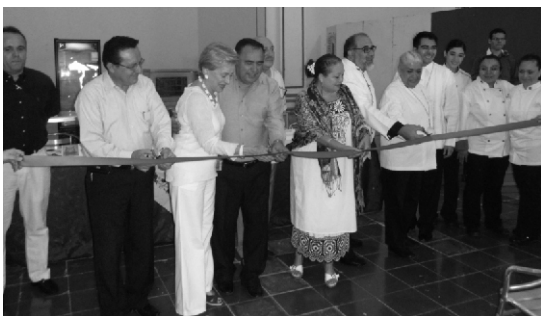
Corte del listón inaugural a cargo de las diversas autoridades.