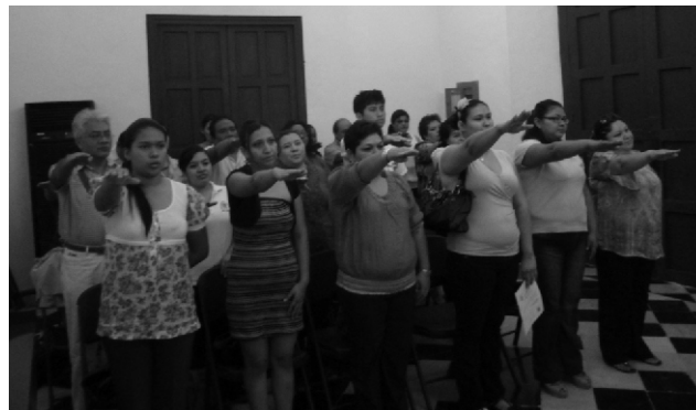
Toma de protesta de los nuevos integrantes del Consejo Superior.

A continuación, enlistamos a los consejeros salientes y entrantes por área.