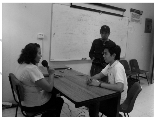
Entrevista para el programa televisivo Gaceta I.C.